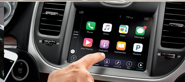
Tecnología Apple CarPlay®/Google Android Auto®