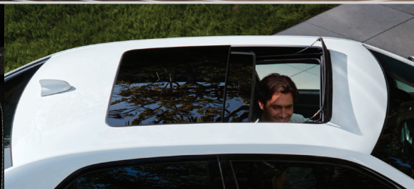
Quemacocos panorámico dual