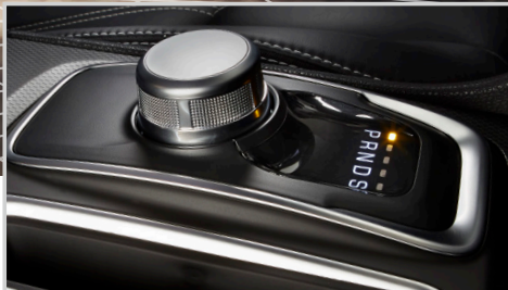
Transmisión automática de 8 velocidades con E-shift rotativo