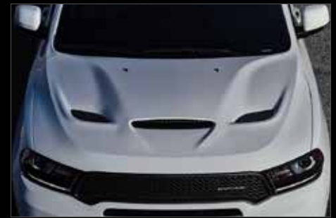
COFRE PERFORMANCE DODGE®