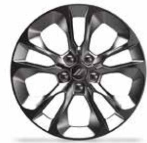
DE ALUMINIO DE 20"