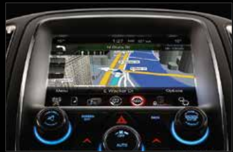
SISTEMA DE ENTRETENIMIENTO UCONNECT® 8.4" CON CONECTIVIDAD APPLE CARPLAY® Y GOOGLE ANDROID AUTO®