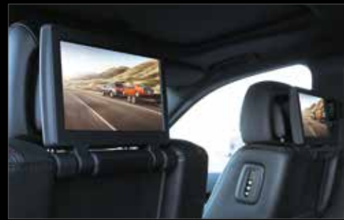
SISTEMA BLU-RAY® EN ASIENTOS TRASEROS, CON DOS PANTALLAS HD, CONTROL REMOTO Y AUDÍFONOS